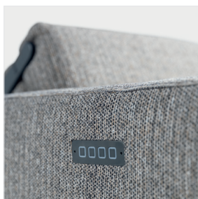
A – Boutons de commande à l'extérieur