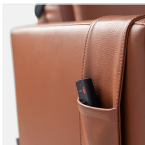
B – Poche latérale séparée